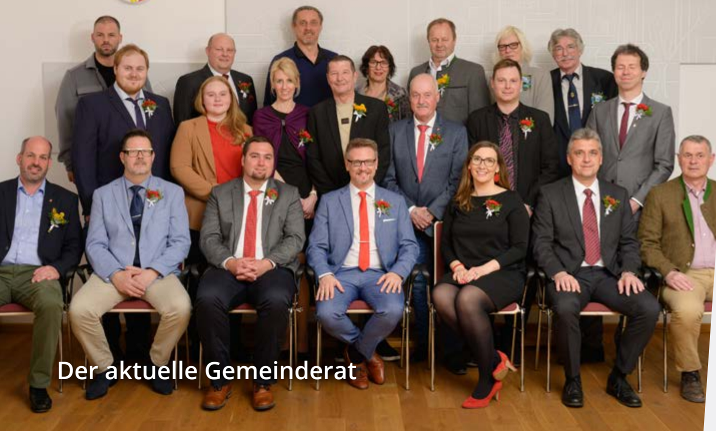
Der aktuelle Gemeinderat