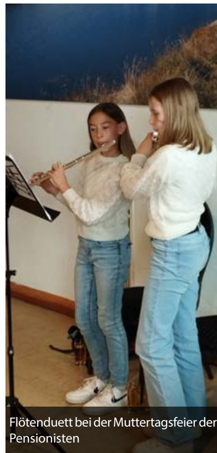
Flötenduet bei der Muttertagsfeier der Pensionisten

Die Vorbereitungen für das kommende Schuljahr sind auch bereits angelaufen, sollten sie oder ihre Kinder Interesse am Erlernen eines Musikinstrumentes haben, nehmen sie bitte Kontakt mit mir auf, ich stehe ihnen für Auskünfte und Beratungen gerne unter der Telefonnummer 0650 / 370 58 63 zur Verfügung.