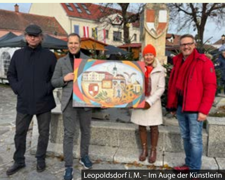
Leopoldsdorf i. M. – Im Auge der Künstlerin