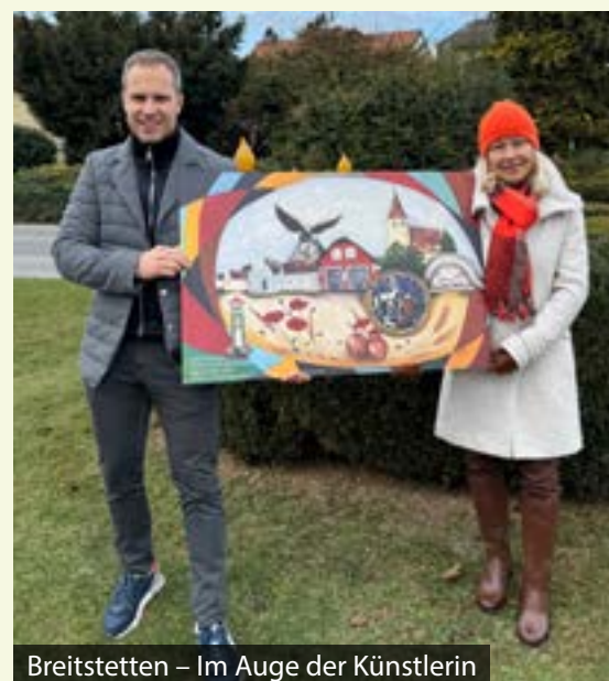
Breitstetten – Im Auge der Künstlerin

Planung, da diese Bestattungsmöglichkeit immer mehr an Zustimmung gewinnt.